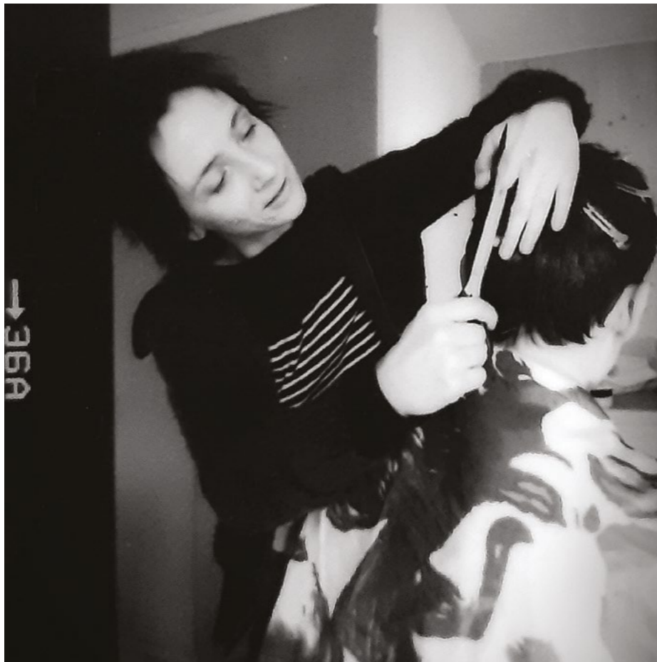
Die Coiffeuse, eine sehr geschätzte Dienstleistung.